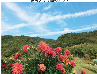
黒川ダリヤ園のダリア