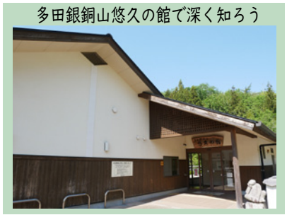
多田銀銅山悠久の館で深く知ろう