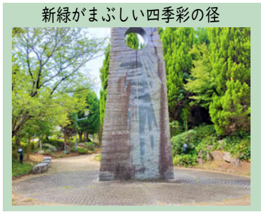
新緑がまぶしい四季彩の径