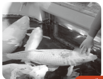
本堂の横には大きな錦鯉が泳いでいます