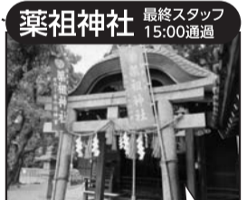
日本最古の薬祖神社で癒し の神様として知られています

御礼 2019年の南北ウォークが最終回となりました。多くの皆様のご参加、ありがとうございました。2020年の開催は2月末にHPでお知らせいたします。