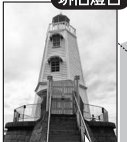
明治10年(1877年)に築られた 日本最古の木造洋式燈台です

参加条件 ●健康状態のすぐれない方は参加をご遠慮ください。ご自分の体力、体調をチェックされた上でご参加ください。ただし、子ども(小学生以下)と75歳以上の方の単独参加はご遠慮ください。 ●参加者のけがや他に与えた損害等については、主催者は一切の責任を負いません。 ●このウォーキングで主催者側が撮影した写真が報道、パンフレット等に掲載されることをご了承ください。