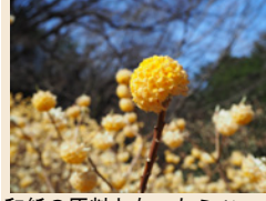
和紙の原料となったミツマタ