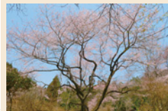
源治丸桜はエドヒガン ※源満仲公が藤原仲光へ養子として与えたのが源治丸と伝わる