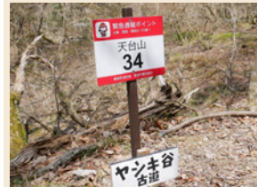
高貴な方のお屋敷跡?