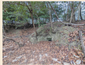
天台山コースに残る炭焼き窯跡