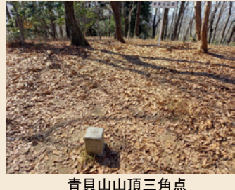
青貝山山頂三角点

妙見口駅前のトイレはたいへん混雑します 乗換駅の川西能勢口駅または山下駅で事前のご利用をおすすめします