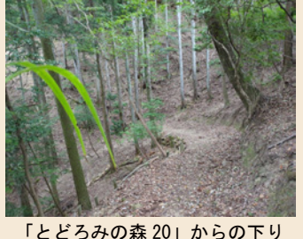
「とどろみの森 20」からの下り