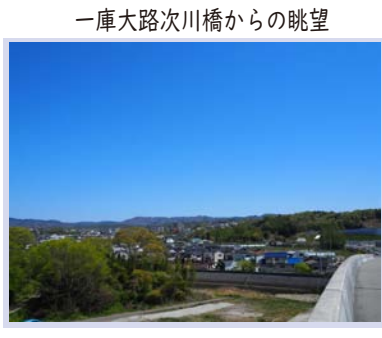
一庫大路次川橋からの眺望