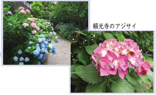
頼光寺のアジサイ

○お問い合わせ (9:30 ~ 17:30、土・日・祝日を除く) 能勢電鉄ハイキング担当 072-792-7716 ○当日の決行・中止のお問い合わせは (午前6時以降) 応答専用ダイヤル 072-792-7227