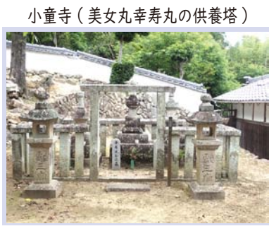
小童寺（美女丸幸寿丸の供養塔）