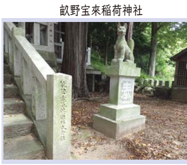
畝野宝来稻荷神社