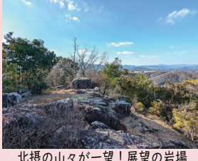
北摂の山々が一望! 展望の岩場