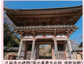
久安寺の楼門(国の重要文化財 室町初期)