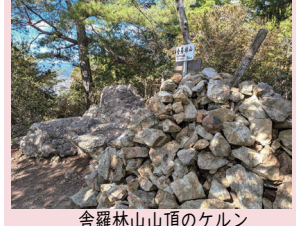
舎羅林山山頂のケルン