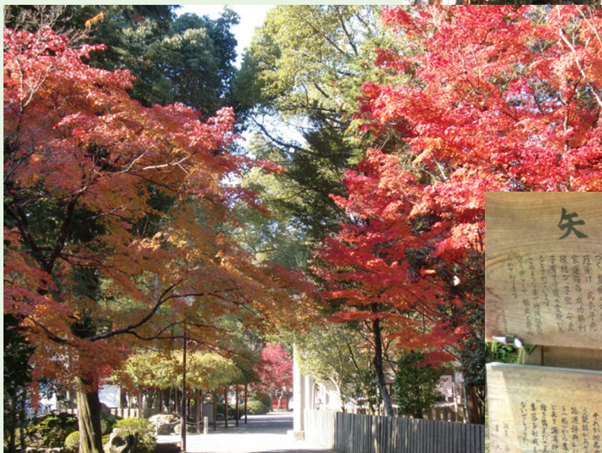
やとう たぶと 矢問の氏神 平野大明神（今の多太神社）の 宮地として創建された矢問八幡宮