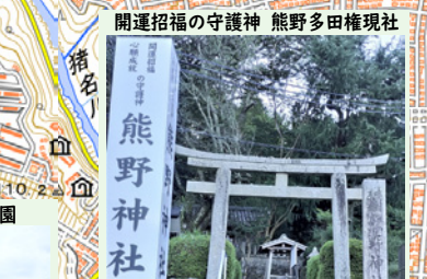
開運招福の守護神 熊野多田権現社