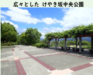
広々とした けやき坂中央公園