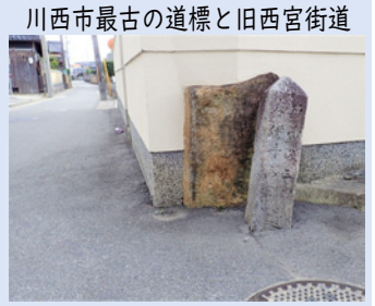
川西市最古の道標と旧西宮街道