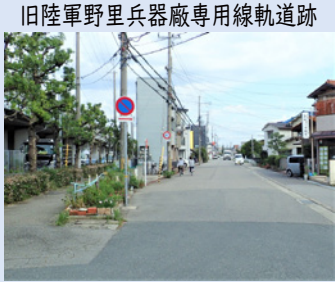
旧陸軍野里兵器廠専用線軌道跡