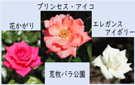
プリンセス・アイコ