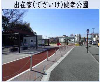
出在家(でざいけ)健幸公園