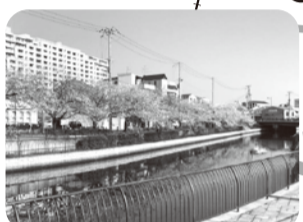
2 内川(旧環濠)沿いの桜

スタート・ゴールエリアなどでは、マスクを着用していただくなどの感染防止にご協力をお願いします